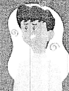
Falta de ar