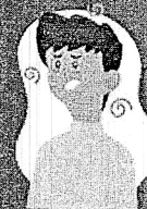
Falta de ar