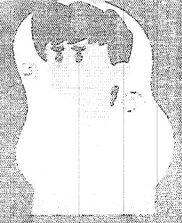
Falta de ar