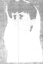
Dificuldade de respirar