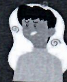
Falta de ar