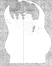
Falta de ar