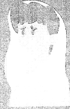
Dificuldade de respirar