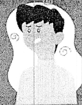
Falta de ar