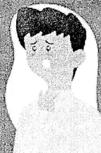
Dificuldade de respirar