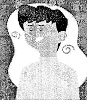
Falta de ar