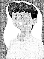
Dificuldade de respirar