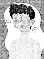
Falta de ar