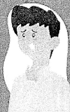
Dificuldade de respirar