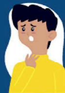
Dificuldade de respirar