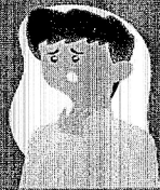
Dificuldade de respirar