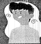
Falta de ar