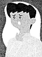
Dificuldade de respirar