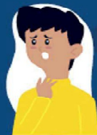
Dificuldade de respirar