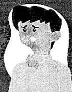
Dificuldade de respirar