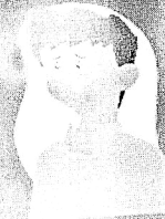
Dificuldade para respirar