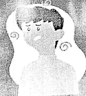
Falta de ar