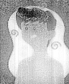
Falta de ar