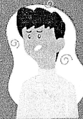
Falta de ar