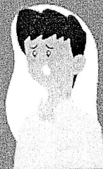
Dificuldade de respirar