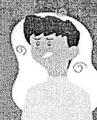
Falta de ar